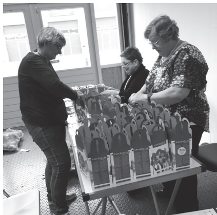
Het in doosjes pakken van de 870 bollen.